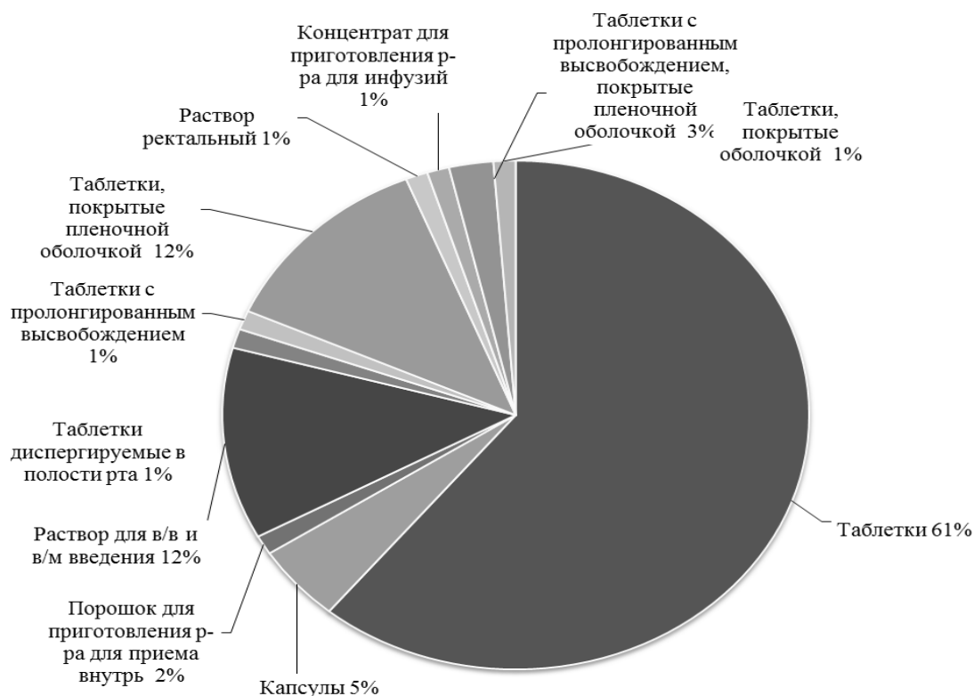
Рис. 2. Ассортимент лекарственных препаратов группы «Анксиолитики», критерий – лекарственные формы

Доля лекарственных препаратов импортного производства составляет 12% от общего числа. Это свидетельствует о невысокой зависимости данной группы от зарубежных производителей. Тем не менее, для двух лекарственных препаратов – Элениум (МНН – Хлордиазепоксид) и Стрезам (МНН – Этифоксин), не имеющих аналогов среди лекарственных препаратов отечественного производства, данный вопрос является актуальным и требует особого внимания. На рис. 3 представлена структура долевого распределения по странам-производителям. В таблице представлены производители исследуемых лекарственных препаратов с указанием страны и занимаемой долей рынка.