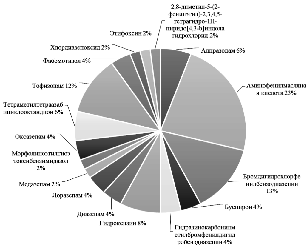
Рис. 1. Ассортимент лекарственных препаратов группы «Анксиолитики», критерий – состав, МНН

оформления бланков рецептов, в том числе в форме электронных документов» [24, 25]. Постановление Правительства РФ от 30.07.1994 N 890 (ред. от 14.02.2002) «О государственной поддержке развития медицинской промышленности и улучшении обеспечения населения и учреждений здравоохранения лекарственными средствами и изделиями медицинского назначения» определяет категории заболеваний и группы населения, которым данные лекарственные препараты могут быть отпущены бесплатно [26]. Для амбулаторного лечения льготных категорий граждан наиболее предпочтительны следующие лекарственные формы: все таблетированные формы и капсулы, как наиболее удобные для самостоятельного применения.