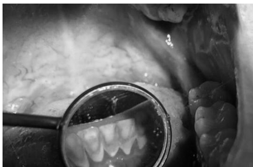
Рис. 2. Студентка А., 21 лет, твердые зубные отложения

Студентка В., 20 лет, курит 6 лет по 10 сигарет в день. Хронические заболевания отрицает. Перенесенные воспалительные заболевания слизистой оболочки рта: ангина. Утверждает, что воспаления появляются минимум 2 раза в год. На момент осмотра жалобы на изменение цвета зубов, кариес; нерегулярно чистит зубы – 1 раз в день. За последние 5 лет всего один раз посещала стоматолога. На момент обследования выявлены множественные кариозные процессы и твердые зубные отложения (рис. 2). Результаты анкетирования представлены в таблице 2.